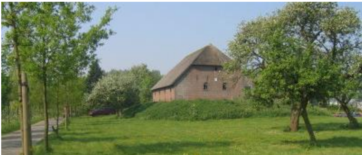
Behoud van monumentale bedrijfsgebouwen door ruime mogelijkheden voor hergebruik

De in dit beleidskader genoemde mogelijkheden voor hergebruik van agrarische bedrijfsgebouwen gelden nadrukkelijk niet voor kassen. Uitgangspunt bij kassen is dat die bij functieverandering altijd dienen te worden gesloopt.