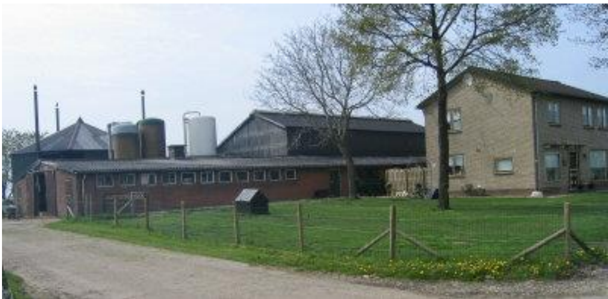
Bij functieverandering moeten alle agrarische gebouwen op het perceel gesloopt worden

Bij het berekenen van de oppervlakte van de gesloopte bedrijfsgebouwen worden overigens alleen de bedrijfsgebouwen (stallen/loodsen/glasopstanden/opslagruimtes) meegerekend. Aan de sloop van bouwwerken, bij recht toegestane bijgebouwen bij de woning, tunnelkassen en overige voorzieningen kunnen dus geen bouw mogelijkheden worden ontleend.