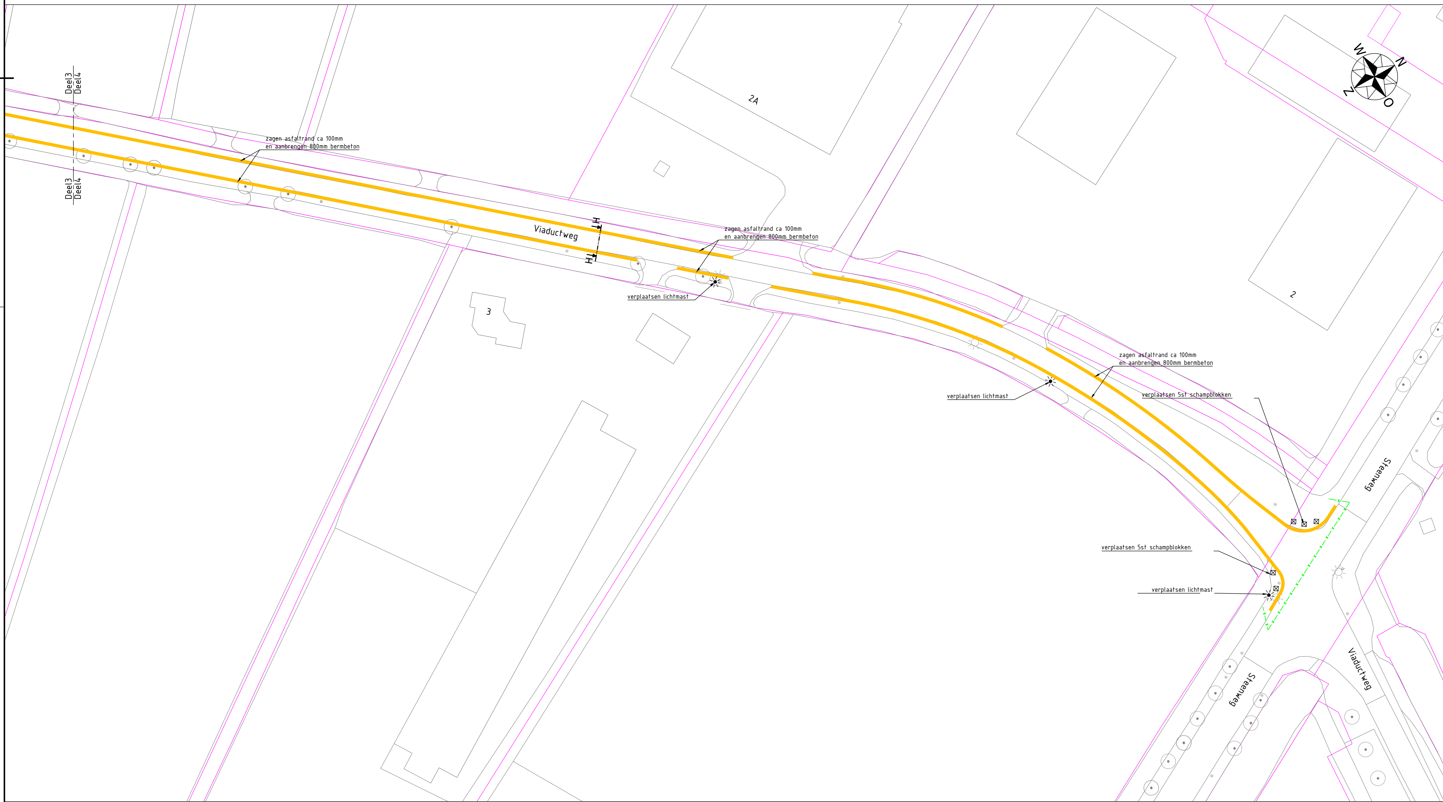
Deel 4: Viaductweg